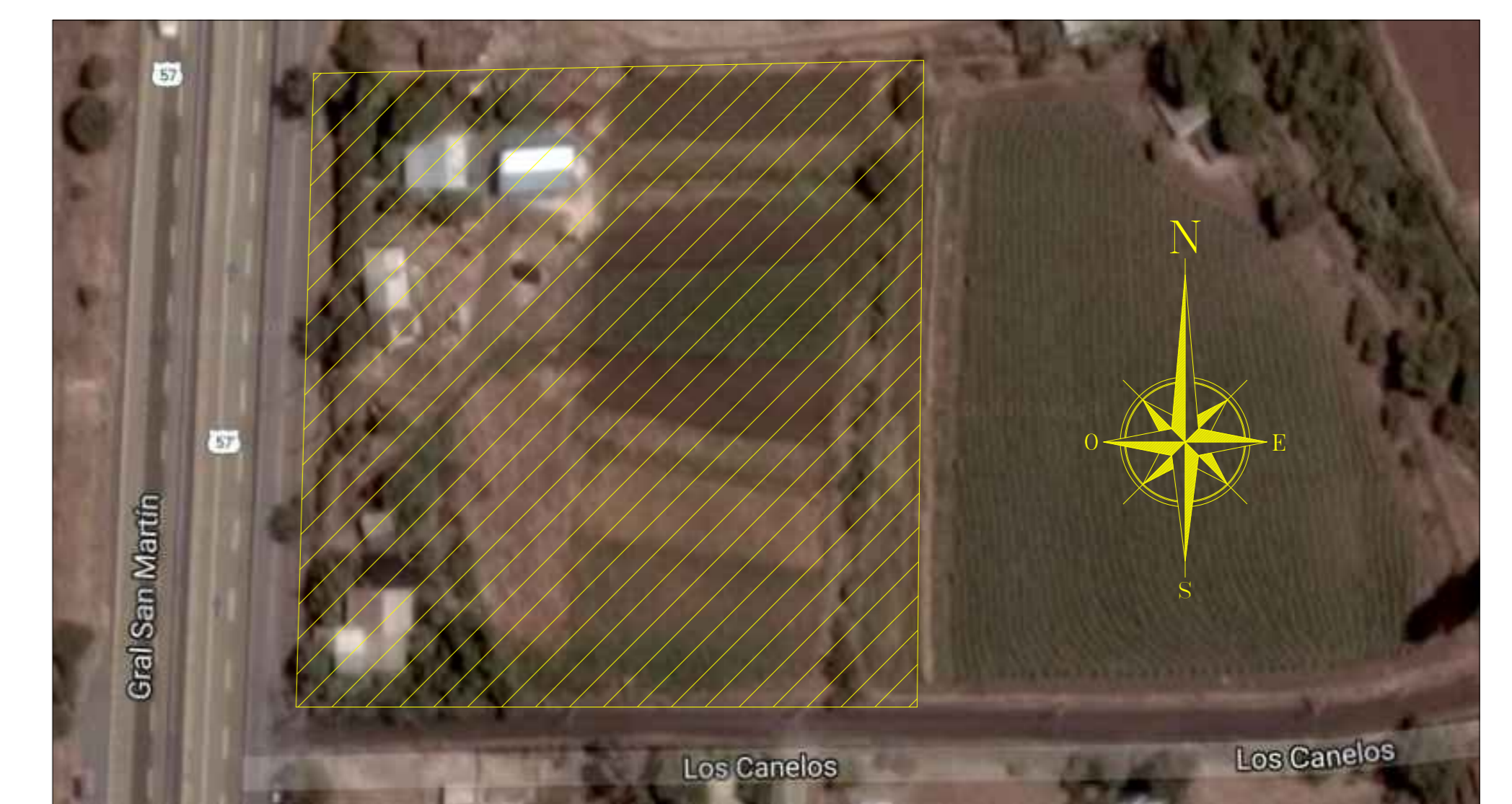
IMAGEN SATELITAL DEL PREDIO